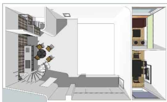
广州影棚 一层立面图