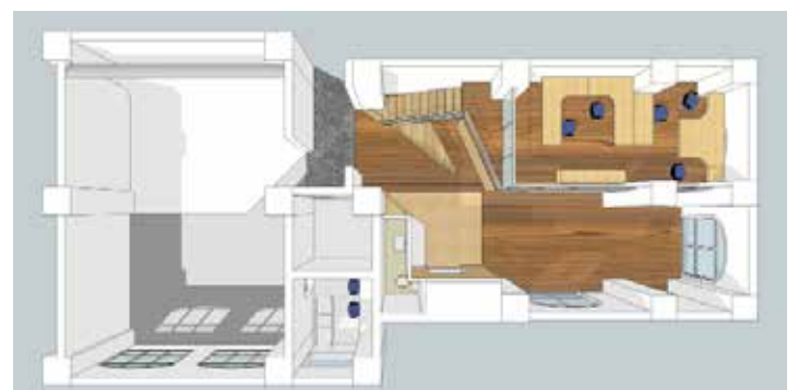
Studio C 二层立面图