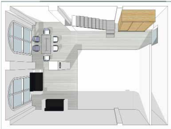
Studio A 一层立面图