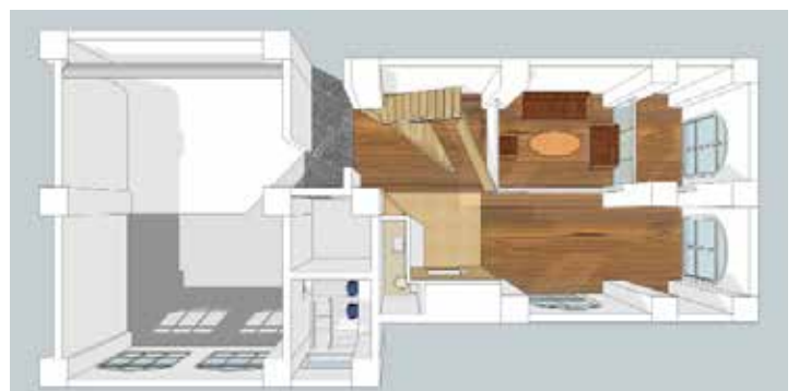
Studio C 一层立面图