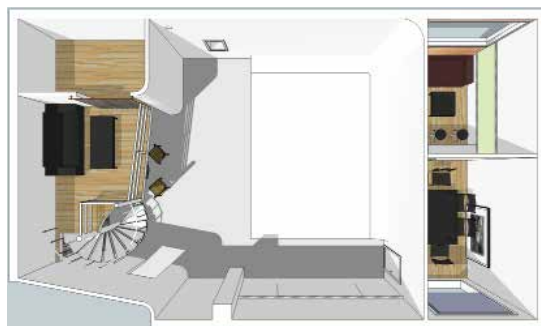
广州影棚 二层立面图