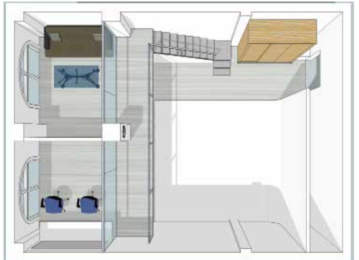
Studio A 二层立面图